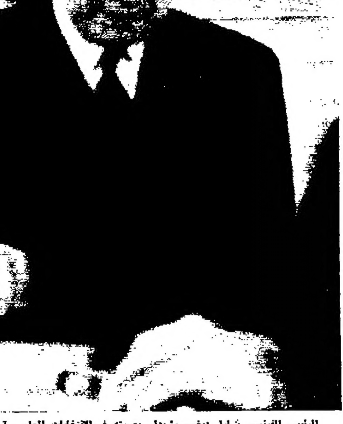
الرئيس الفرنسي شارل ديغول يفتحه في الانتخابات العامة يوم الاحد الماضي

وكلفت الاضطرابات قد بدأت مساء يوم الثلاثاء الماضي حين زعم ان رجال البوليس قتلوا المصبي الذي انهم بمرقة سيارة.